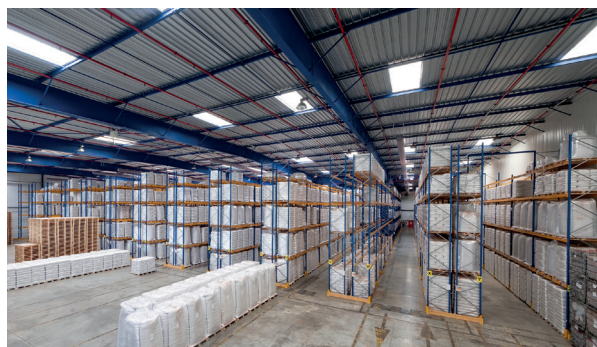
HUB 2 : Stockage en racks