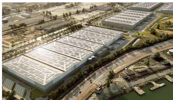
HUB 3 : Vue extérieure générale 38 000 m 2 répartis en 6 cellules