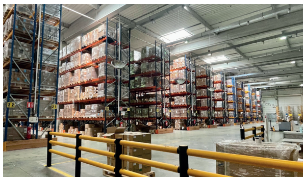
HUB 1 : Stockage en racks 18 000 m 2 de stockage racks et zones de préparation