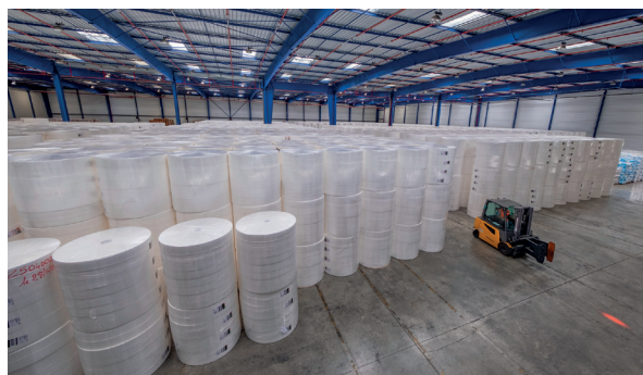
HUB 2 : Stockage en ilots