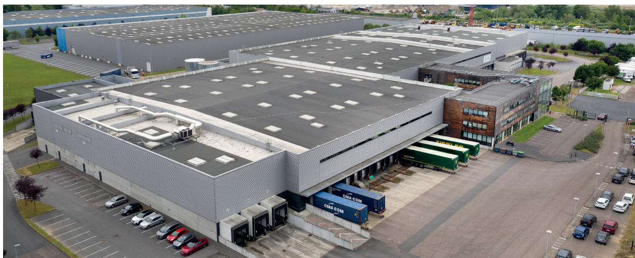
HUB 1 : Vue générale 34 quais et 4 accès plain-pied

Cyrille Poirier Coutansais 2 , fin observateur de la géopolitique, a mis en évidence les mouvements historiques de relocalisation poussés récemment par la COVID et les conflits armés. Il a ensuite expliqué comment concilier la mondialisation avec les réalités locales. Jean-Baptiste Gastinne 3 a témoigné de l'importance de l'axe Seine et de l'implication forte de Sénalia dans le développement normand local.