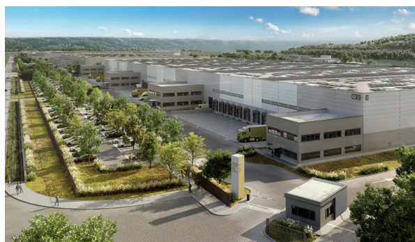
HUB 3 : Vue extérieure 39 quais et 6 accès plain-pied